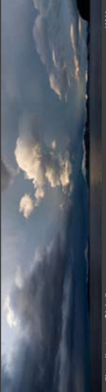
"Lysglimt over Giske"